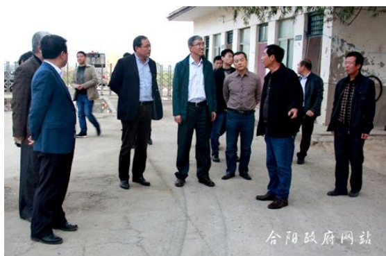
在洽川镇莲菜种植腐败病防控技术示范地调研