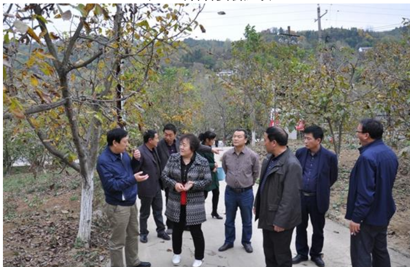
在上岭核桃园实地调研

专家们在上河村上岭核桃园进行了实地考察和调研，在核桃园区就核桃栽培科学管理与林下立体配套作务进行了调研考察。在上河村村委会，我校扶贫办有关负责人、专家与商州林业局、扶贫办、上河村驻村干部、涉农企业及部分贫困户代表进行了座谈。大家畅所欲言，就上河村核桃产业发展中遇到的栽培管理技术、立体种养提质增效、产品未来发展、产品质量认证及生态旅游采摘等进行了热烈的讨论。