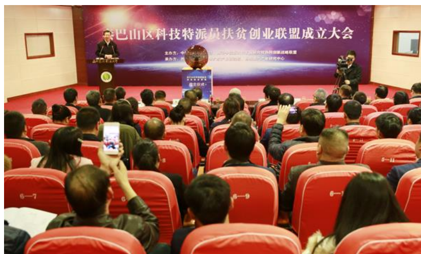
“秦巴山区科技特派员扶贫创业联盟”在我校成立

“秦巴山区科技特派员扶贫创业联盟”由我校六次产业研究院、杨凌第六产业研究中心、中国青年政治学院新农村发展研究院、深圳市先进制造业促进会，联合57家秦巴山区科技特派员所创办企业共同发起成立，是全国高等学校新农村发展研究院协同创新战略联盟下属的扶贫联盟，旨在深入贯彻国家《科技特派员制度》，充分发挥高校智力资源与科技成果在秦巴山区扶贫创业中的重要作用，积极探索秦巴山区第六产业模式和大学推广模式的升级版，优势互补、整合资源，做六次产业理论在秦巴山区的积极倡导者和实践者，服务秦巴山区精准扶贫战略。