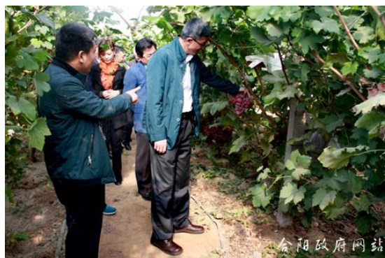
在黑池镇甘薯扶贫示范地调研