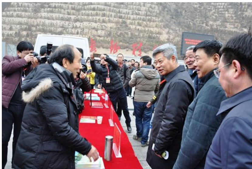
陕西省委常委、延安市委书记徐新荣看望现场咨询的我校专家教授