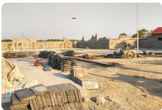
建设中的文化广场