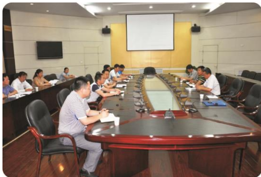
与合阳县委县政府座谈