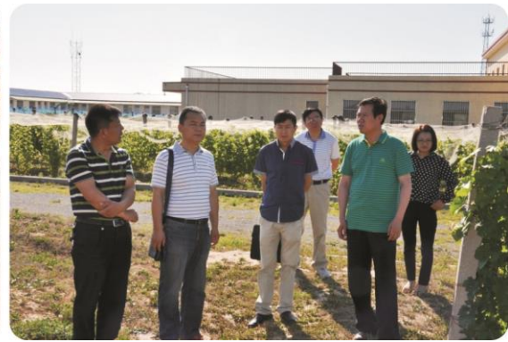
走访我校葡萄试验示范站

此次对接和调研是我校扶贫领导机构成立后的首次对接和调研。通过对接，明确了校地对接的工作部门和机构，为今后的定点扶贫工作对接理清道路。通过调研获取第一手的贫困现状、贫困户结构、脱贫意愿、县域产业发展需求、脱贫