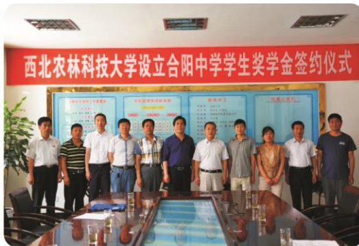
合阳中学奖学金签约仪式

在合阳中学，在前期对接沟通的基础上，与合阳中学签定了“西北农林科技大学奖学金”，2016年我校资助2万元在合阳中学奖励20名品学兼优的莘莘学子。在共青团合阳县委，工作组与团县委负责人就公益扶贫、西农博士团志愿服务活动、就业扶贫、青年电商培育等活动进行对接和统计。在合阳县职教中心，工作组了解了职教中心的学生结构组成、师资结构、社会服务功能方式、示范实训基地等情况，并就双方开展农业示范园指导建设和农业科技培训计划进行深入探讨，达成初步计划。