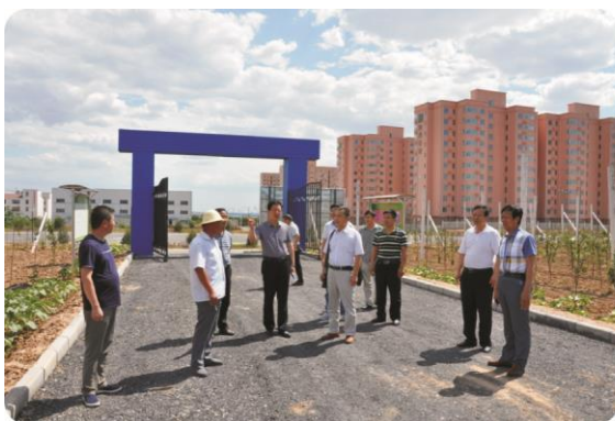
在合阳县职教中心示范基地调研

在合阳中学，在前期对接沟通的基础上，与合阳中学签定了“西北农林科技大学奖学金”，2016年我校资助2万元在合阳中学奖励20名品学兼优的莘莘学子。在共青团合阳县委，工作组与团县委负责人就公益扶贫、西农博士团志愿服务活动、就业扶贫、青年电商培育等活动进行对接和统计。在合阳县职教中心，工作组了解了职教中心的学生结构组成、师资结构、社会服务功能方式、示范实训基地等情况，并就双方开展农业示范园指导建设和农业科技培训计划进行深入探讨，达成初步计划。