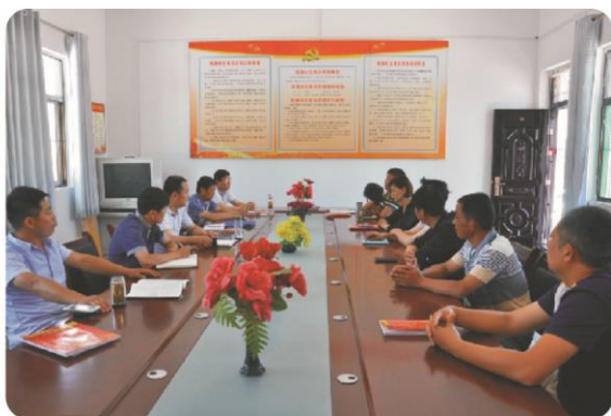
在乾落村座谈交流