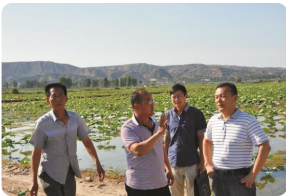
在洽川镇莲菜种植田检查