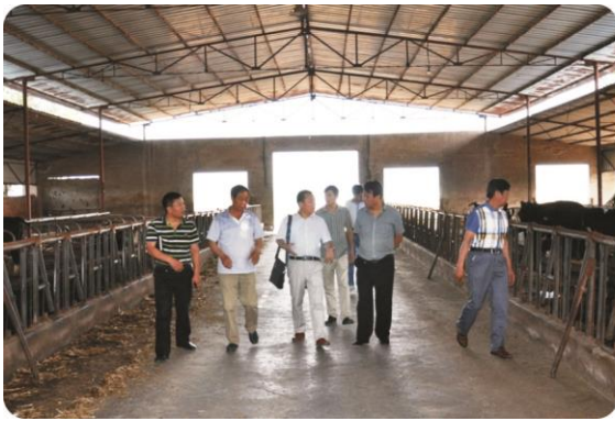
在朔东奶牛场检查