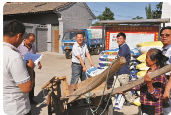
在洽川镇为贫困户发放莲菜种植物资