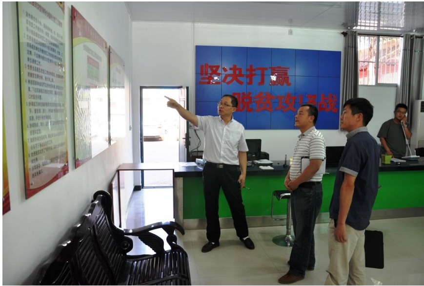
在合阳县脱贫攻坚指挥部调研

工作组还调研了合阳县莲菜、红提葡萄、红薯、奶畜、樱桃、无籽西瓜等产业情况。并在黑池镇、洽川镇、合阳县翊东奶牛场检查了 2016 年我校开展的 3 个产业帮扶项目的落实进展工作。走访了我校合阳葡萄试验示范站，落实暑期大学生社会实践基地及准备近期开展相关帮扶活动对接等。