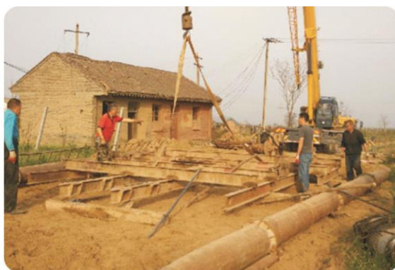
机井项目开工建设