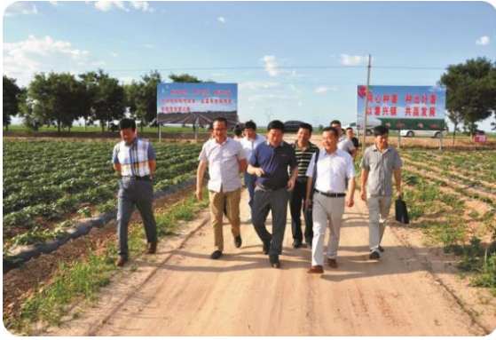
在黑池镇红薯示范田检查