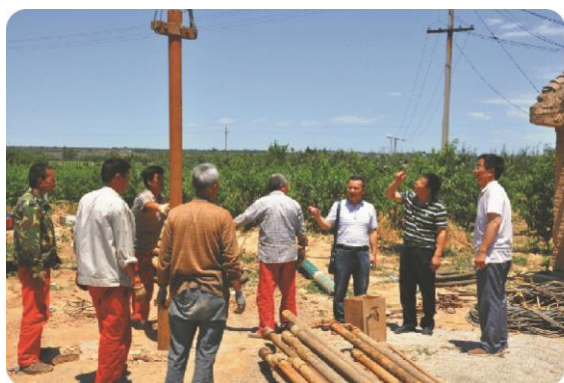
调研乾落村基础设施建设